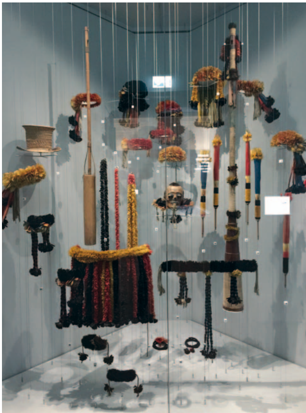
Abb. 1 Vitrine mit Federschmuck und Kopftrophäe der Mundurukú.

Am 27. November 2017 berichtete das »Ö1 Morgenjournal« drei Minuten lang (7:24-7:27) zum Thema »Kritik an ‚Kopf-Trophäe‘ im Weltmuseum«, und am selben Tage folgte eine etwa achtminütige Sendung (17:17-17:25) im »Kulturjournal«: »Vor einem Monat wurde das Weltmuseum in Wien eröffnet – aber ein Exponat, das da zu sehen ist, sorgt für Aufregung: Eine »Kopftrophäe«, also der Kopf eines ermordeten Menschen, der Anfang des 19. Jahrhunderts nach einer Expedition den Weg nach Wien gefunden hat.«