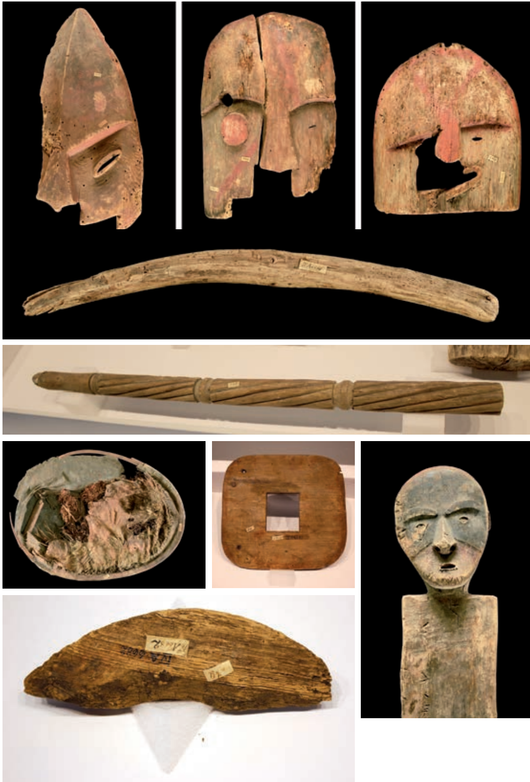
Abb. 4 bis 12 Die neun Objekte

denn der »Zustand der betroffenen Objekte ist für eine öffentliche Präsentation in Deutschland nicht geeignet.« 6 Die oben genannten Einträge im Inventarbuch (2. Spalte) zeigen jedoch, dass mindestens zwei Masken (IV A 6674, IV A 6675), die Kinderwiege (IV A 6678), die Figur (IV A 6679) und ein Stab (IV A 6681) in den 1920er-Jahren im Berliner Völkerkundemuseum ausgestellt waren.