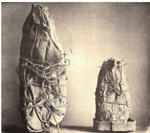
Abb.14 Mumienbündel in Zedernbast eingehüllt

der Gemeinschaft sehr geachtet waren, wurden sie während der Jagdsaison als unrein betrachtet. Der Beruf wurde in der Familie weitergegeben und die Körper erfolgreicher Jäger wurden von den Nachfahren mit religiöser Verehrung behandelt. Diese Mumien waren in Höhlen versteckt und nur den Eigentümern war deren Lage bekannt. Es wurde als großes Glück betrachtet in den Besitz von Mumien erfolgreicher Jäger zu gelangen. Um seinen Erfolg bei der Waljagd zu vergrößern, stahl ein Jäger, wenn er konnte, die Mumien eines anderen, und verbrachte diese heimlich in seine eigene Höhle.« (1875: 439 f.)